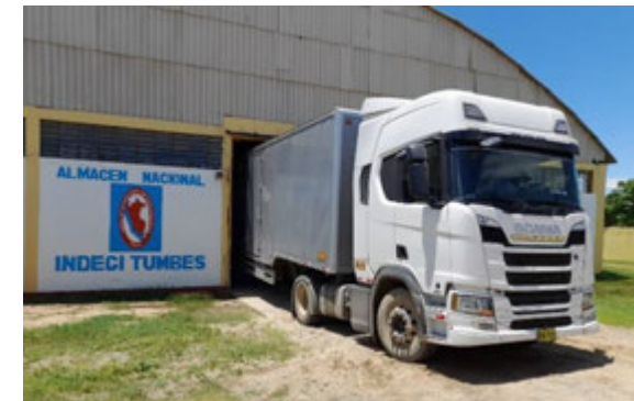
Donación de Transporte - INDECI Tumbes