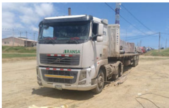
Donación de Transporte - INDECI