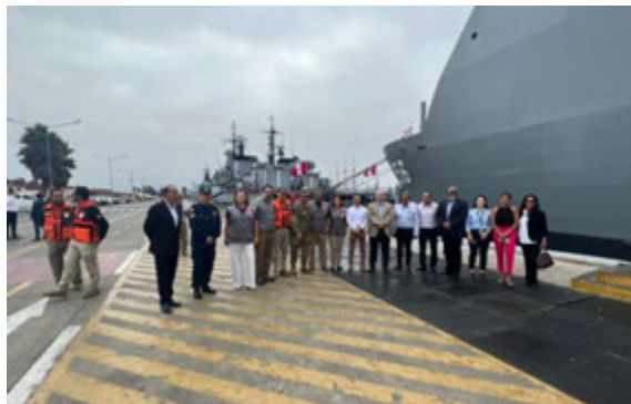
Donación de Transporte de Ayuda Humanitaria - Hombro a Hombro e Indeci