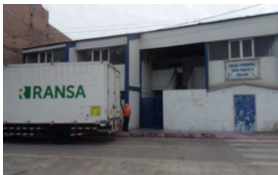
Donación de canastas navideñas - Callao