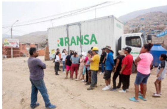
Donación de Transporte - Fundación Romero y Alicorp