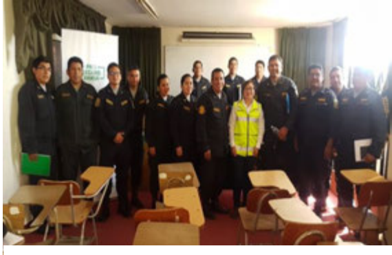
Policía Nacional del Perú