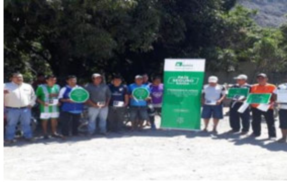
Conductores propios y/o terceros