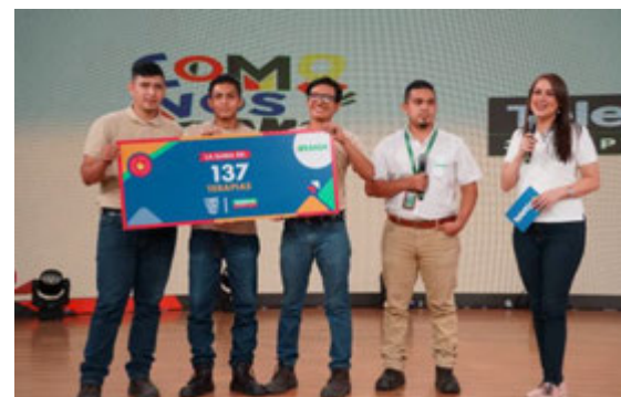
Donación - Teletón El Salvador