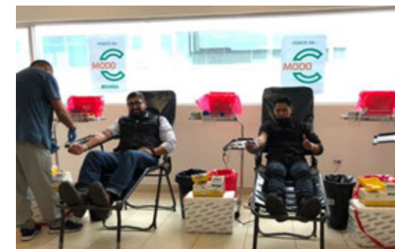
Donación de Sangre - Ecuador