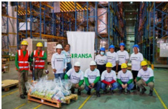
Donación de Maquila - Fundación Romero y Alicorp